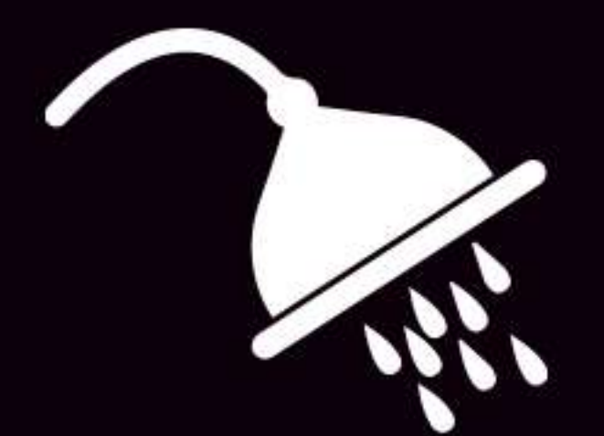
Baño completo con amenidades