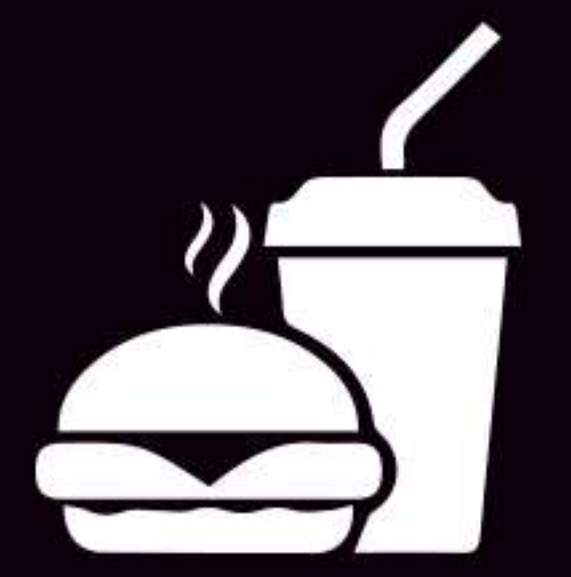
Servicio al cuarto